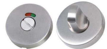
Condamnation avec voyant