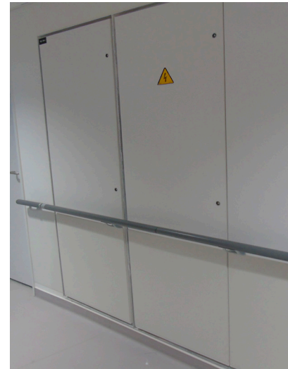
avec option : configuration hospitalière